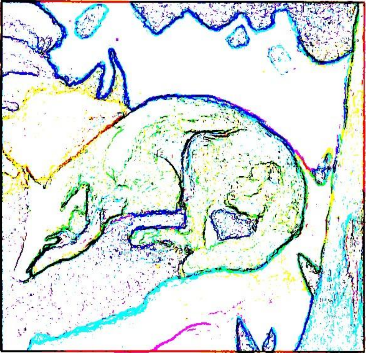
Mamã, Vó! Papá